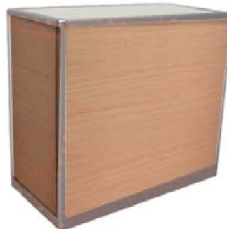
REF. M21 Mostrador Haya