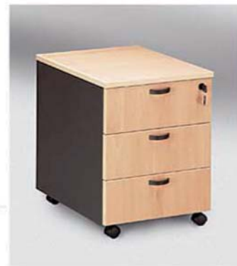
REF. 702 Book Cajones