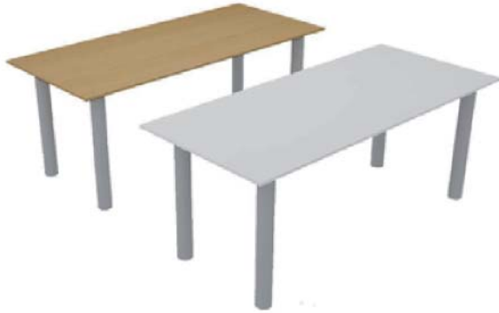
REF. M12 Mesa Trabajo Haya