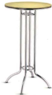
REF. M15 Mesa Alta Bar Cromada