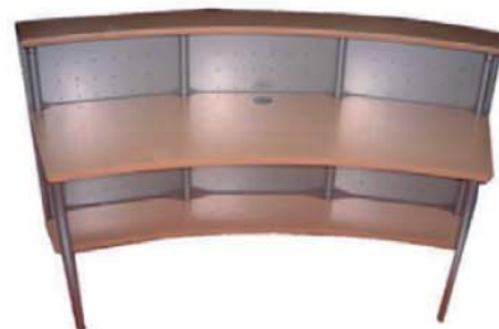
REF. B26 Mostrador Curvo 2 m.