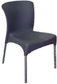
REF. A1 Silla Confidente