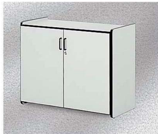
REF. 703/G Armario Auxiliar Gris