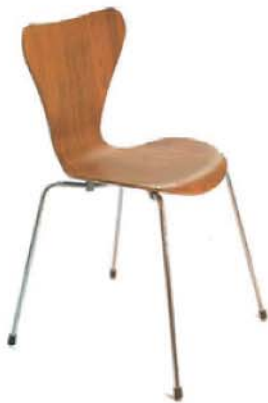
REF. A4 Silla Jacobsen