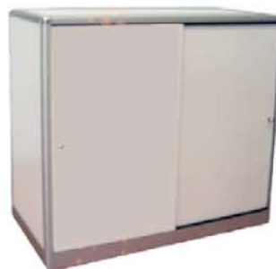
REF. M20 Mostrador Blanco