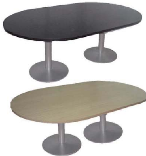
REF. M6 Mesa Despacho Wengé