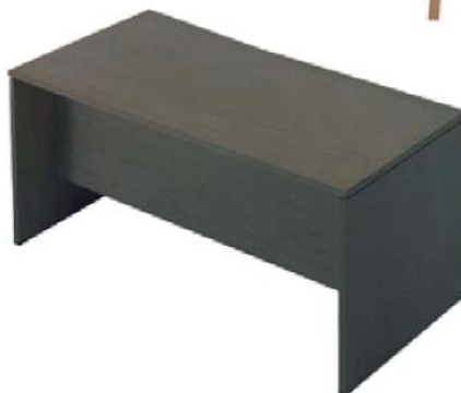
REF. M7 Mesa Despacho Haya