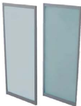
REF. B12 Panel Acristalado