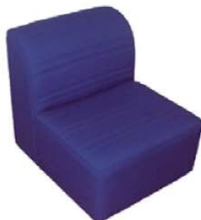
REF. A5 Sillón Descanso