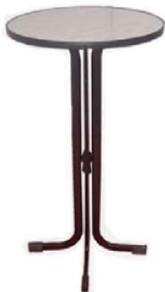
REF. M13 Mesa Alta Bar Blanca