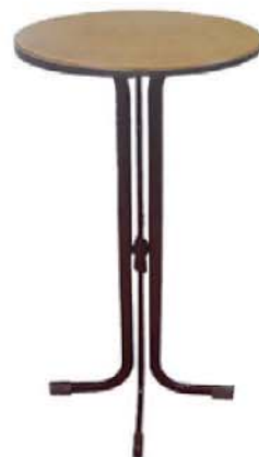
REF. M14 Mesa Alta Bar Haya