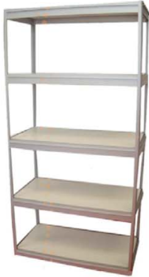
REF. B1 Estantería 5 baldas