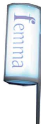
REF. B20 Banderola Retroiluminada