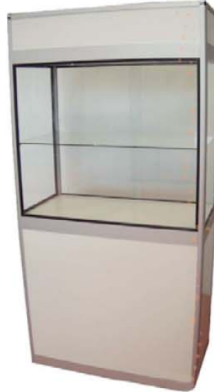
REF. M24 Vitrina 2 m. iluminada