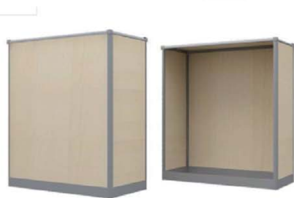
REF. M17 Barra Bar Haya