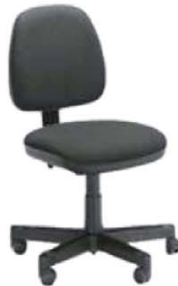
REF. A6 Silla Ruedas