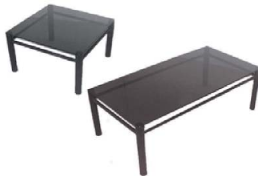
REF. M9 Mesa Cristal Centro