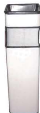
REF. B16 Papelera