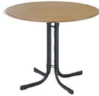
REF. M2 Mesa Redonda Haya