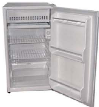
REF. B14 Frigorífico Hotel