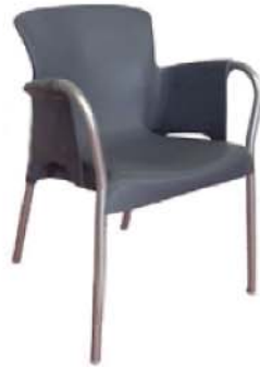
REF. A3 Sillón Confidente