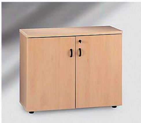
REF. 703 Armario Auxiliar