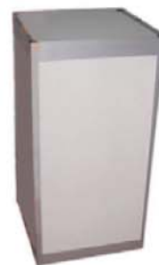
REF. B4 / B5 / B6 Peanas