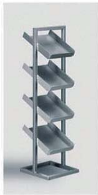
REF. 700 Folletero Gris