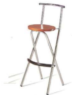
REF. A8 Taburete Haya