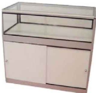
REF. M22 Mostrador Vitrina