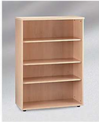
REF. 701 Estantería Madera