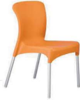
REF. A2 Silla Confidente Naranja