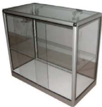
REF. M25 Mostrador Acristalado