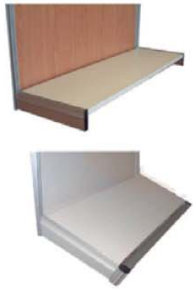
REF. B2 Estante Horizontal