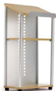
REF. B23 Atril Haya y Plata