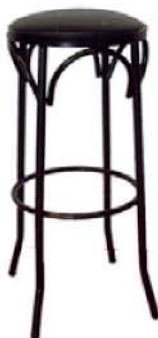
REF. A7 Taburete