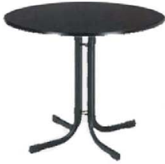
REF. M1 Mesa Redonda Wengé