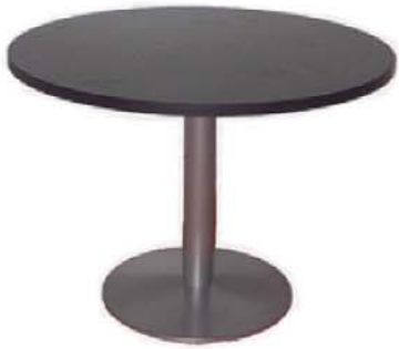
REF. M3 Mesa Diseño Negra