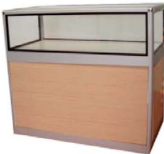
REF. M23 Mostrador Vitrina