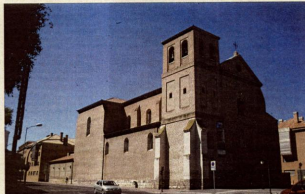
Iglesia de Santiago del Real, en Medina del Campo.

La división de sedes no es la única novedad, pues por primera vez se cobrarán tres euros por la entrada