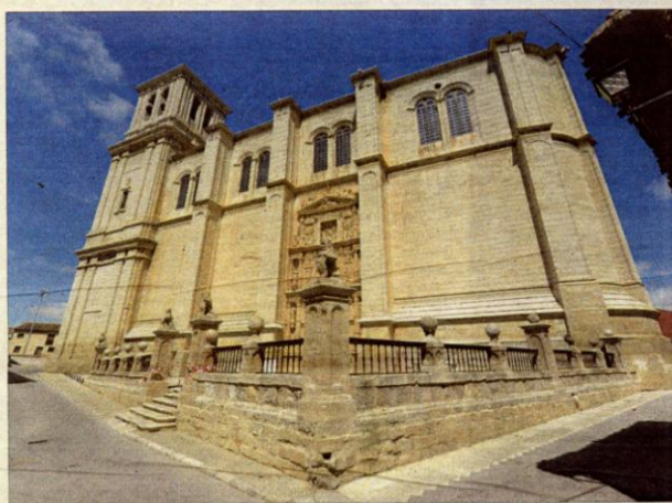
Iglesia de Santiago de los Caballeros, en Medina de Rioseco.

Sobre a la repetición de aquellas que sí se han podido contemplar en muestras pasadas se debe, según subraya Robledo, a que "el discurso de la exposición exige la presencia de alguna de estas obras y nos parecía completamente lógico introducir las", sobre todo teniendo en cuenta que en muchos casos están intrínsecamente relacionadas con el tema de la Semana Santa y la pasión de