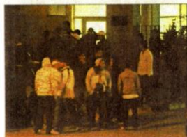
Reportero. Hinchas y amigos expresaron dolor.

En los interrogatorios llevados a cabo por los magistrados del caso, surgieron versiones sobre ventuales presalias que hinchas aurinegros podrían preparar para el clásico, o bien para el