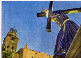
Procesión. Una expresión de fe en Medina del Campo.

Con recogimiento y emoción, hacen el recorrido que termina en la plaza Mayor en la colegiata de San Antolín, el patrono de la villa, el principal