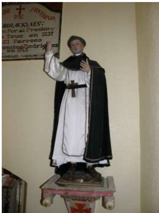
Imagen de vestir, aunque tallada en su totalidad de San Vicente Ferrer que previsiblemente perteneció a la iglesia de la Cruz antes de su derrumbe en los años sesenta del siglo XX. Sede de la histórica Cofradía de la Vera Cruz, su desaparición hizo se repartieran sus bienes muebles por templos de Medina del Campo y su comarca.

Su elección para procesionar excepcionalmente por las calles y plazas de Medina del Campo es debida a que representa al Santo Valenciano que instituyó las Procesiones de Disciplina, antecedente histórico más inmediato de las actuales Procesiones de Semana Santa. Sus sermones itinerantes congregaban a miles de fieles y penitentes que lo seguían pueblo a pueblo formando el Ejército del Pan.