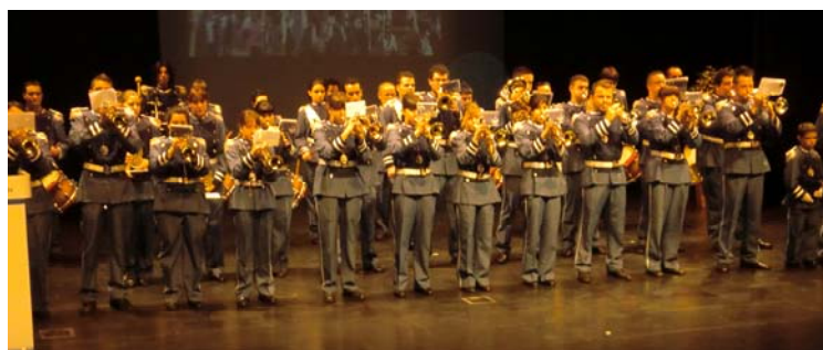
"Agrupación Musical de la Hermandad 15 + 1" de L'Hospitalet de Llobregat

En este acto también tuvo lugar un magnífico concierto de marchas procesionales a cargo de la "Agrupación Musical de la Hermandad 15 + 1" de L'Hospitalet de Llobregat.